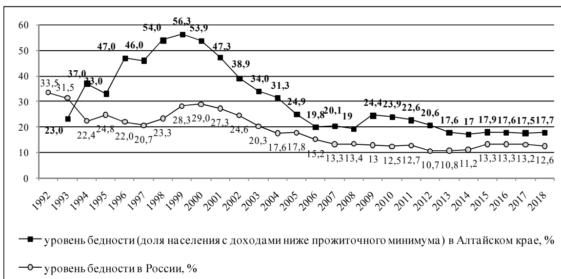
Рис. 17. Доля населения с доходами ниже прожиточного минимума (уровень бедности) в России и Алтайском крае в 1992–2018 гг., %